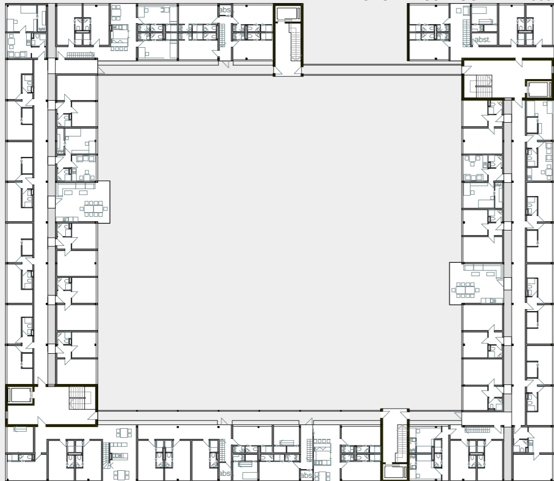
GRUNDRISS 7.UG m. 1 : 500