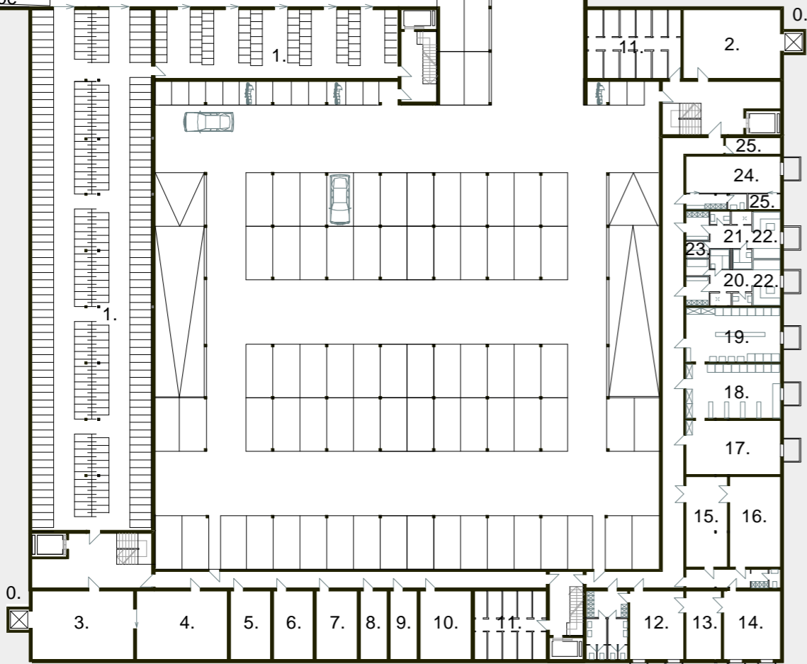
GRUNDRISS 1.UG m. 1 : 500